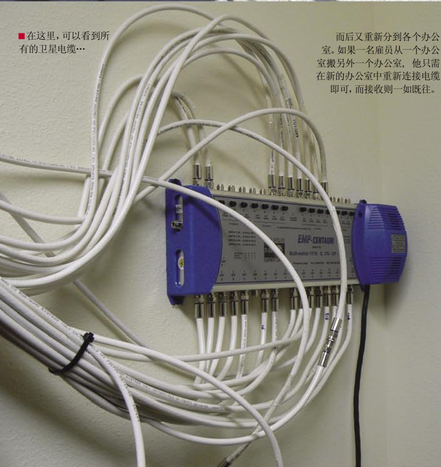
■ 在这里，可以看到所有的卫星电缆...