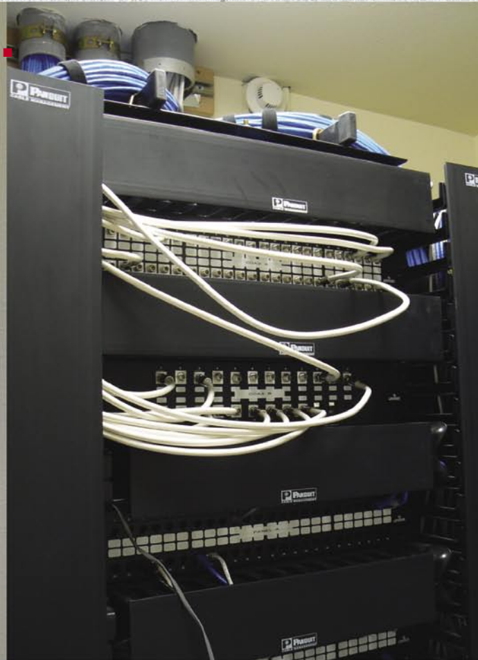
而后再重新分到各个办公室。如果一名雇员从一个办公室搬另外一个办公室，他只需在新的办公室中重新连接电缆即可，而接收则一如既往。