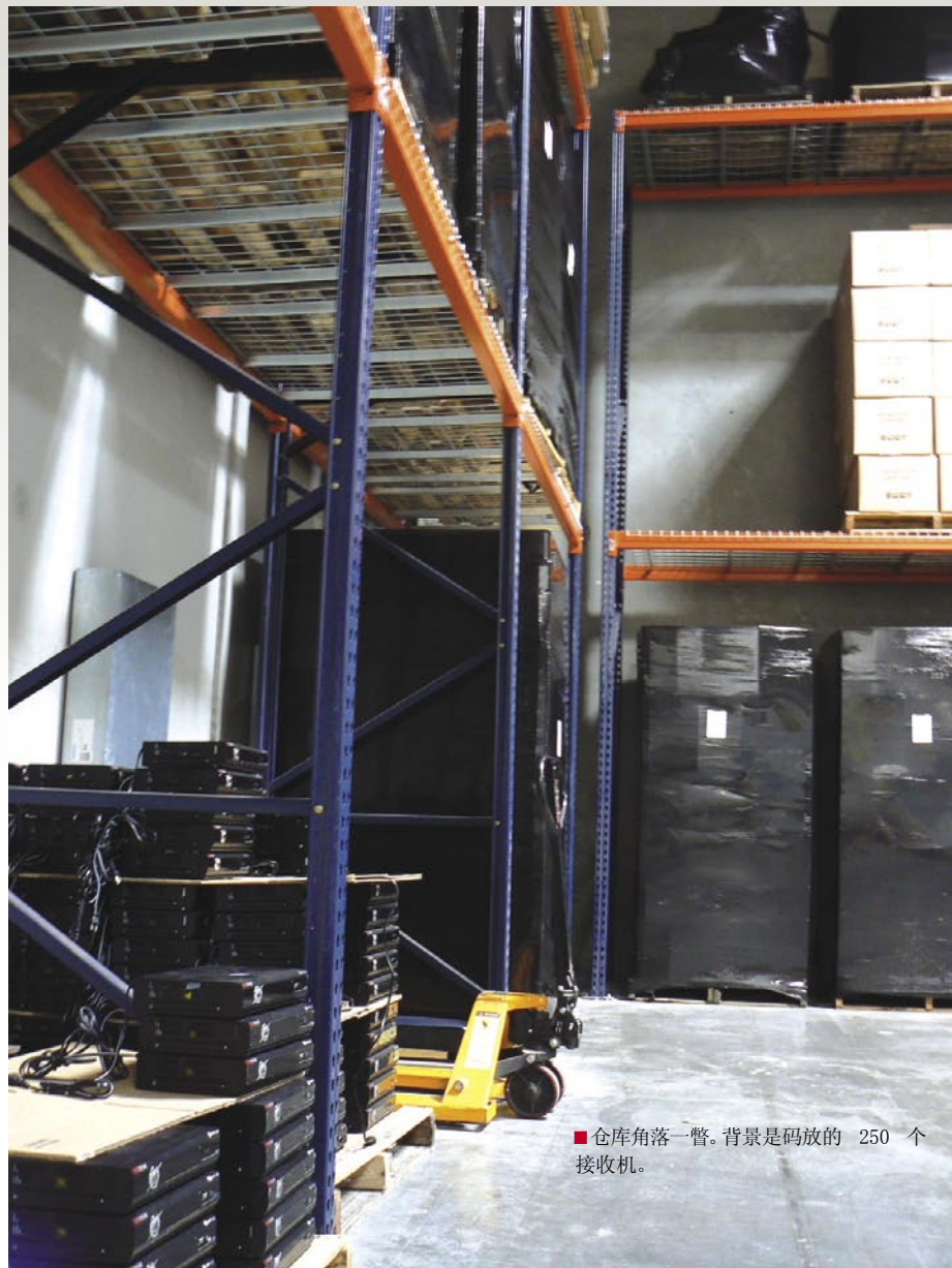
■仓库角落一瞥。背景是码放的 250 个接收机。

罗比·莱茵和钟奎以前在一家计算机公司里共事数年。罗比回忆说:“那时我是这家公司的副总经理,而钟奎是一名销售业务经理。”罗比回忆起那时的许多事情,那时钟奎提出过许多不同的想法。钟奎最后离开了那家公司,而他们也分开好几年。