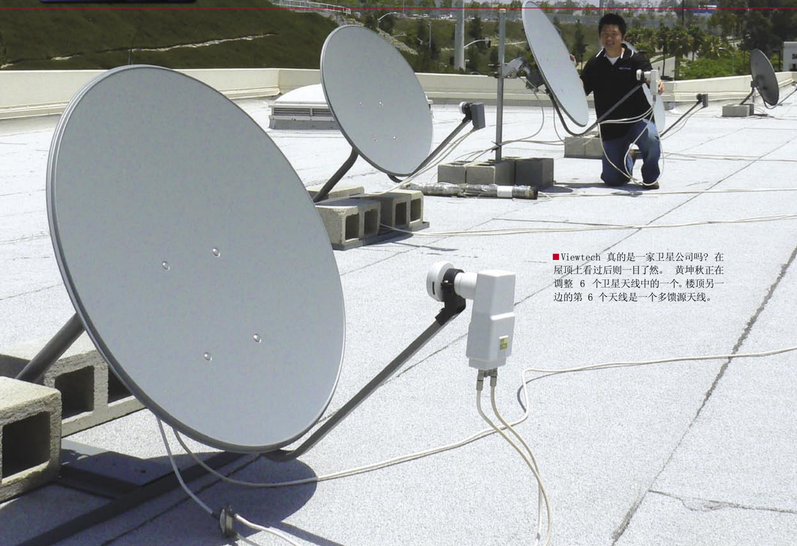
■ Viewtech 真的是一家卫星公司吗？在屋顶上看过后则一目了然。黄坤秋正在调整 6 个卫星天线中的一个。楼顶另一边的第 6 个天线是一个多馈源天线。