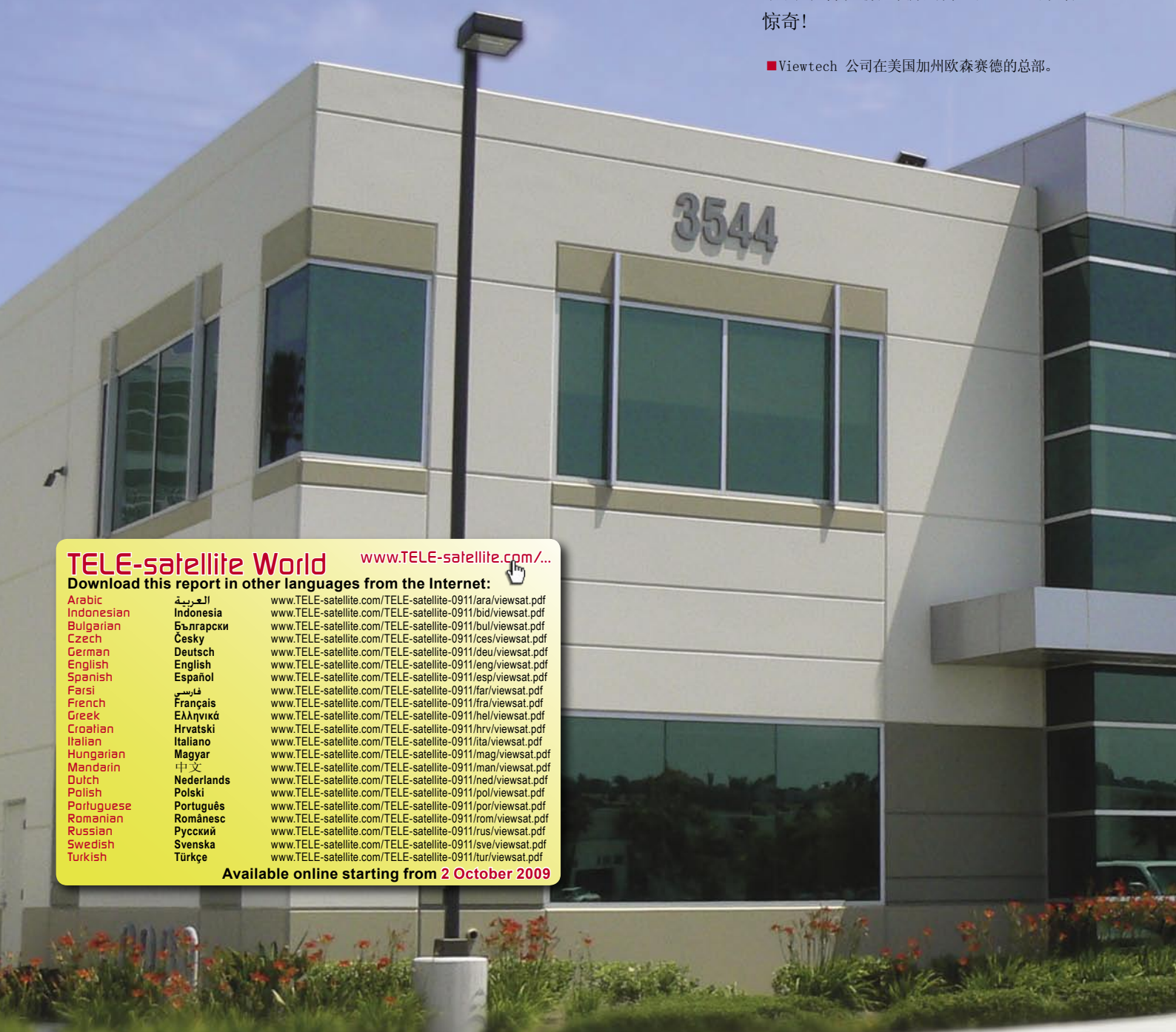
■ Viewtech 公司在美国加州欧森赛德的总部。

这里的灯没有开关, 动作传感器会自动开启天花板上的灯光。百叶窗也会自动开合, 所有的电话线、互联网线和卫星接收馈线都与一个中心位置相连。如果一名员工从一个办公室搬到另外一个办公室, 他只需简单地将其电话机从旧的位置拔出, 再插入新办公室即可, 他的数字电话会跟着他搬到新的办公室。一切令人惊奇!