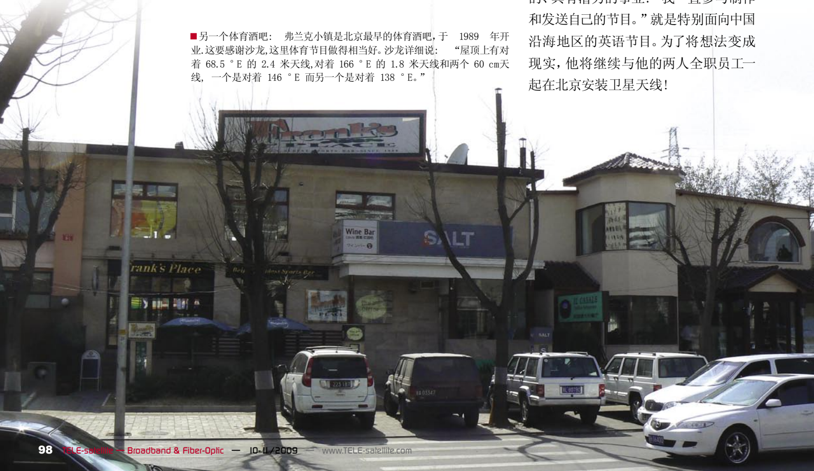
■另一个体育酒吧：弗兰克小镇是北京最早的体育酒吧，于 1989 年开业。这要感谢沙龙，这里体育节目做得相当好。沙龙详细说：“屋顶上有对着 68.5^{\circ}\text{E} 的 2.4 米天线，对着 166^{\circ}\text{E} 的 1.8 米天线和两个 60 cm 天线，一个是对着 146^{\circ}\text{E} 而另一个是对着 138^{\circ}\text{E} 。”

此刻他已经意识到这不是他想要努力的方向。在学习的同时他开始学习英语。1993 年他稍微休息一下，当时他受前任教授邀请在美国中央华盛顿大学度过一年，甚至被允许住在这位教授家里。因为这是一个犹太家庭，而且他的汉语名字听起来与希伯来人问候语沙龙非常相似，所以他的新绰号就这样诞生了！