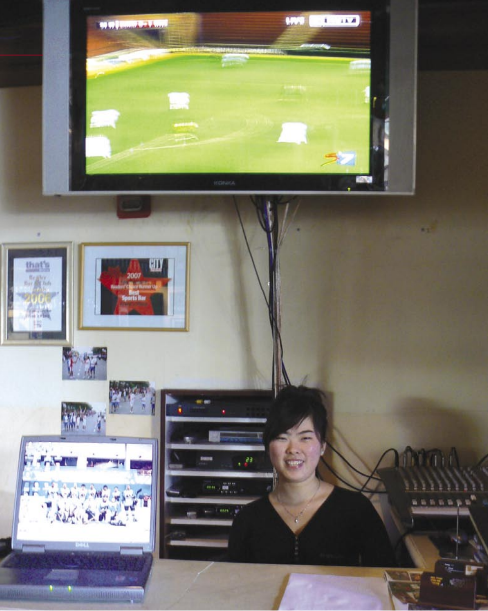
■赫柏是弗兰克小镇酒吧的一位招待员。他站立在存放接收机的小屋前。住在美国的一位朋友通过 Slingbox 正在提供 TSN 体育频道的使用权限。法兰克福的断言是完全正确的：“电视娱乐覆盖面最广。”