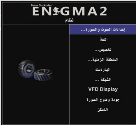
■ 这就是亚哈亚努力的结果：屏幕截图显示 Enigma2 接收机软件的菜单词条。所有阿拉伯语文本文件已经被亚哈亚翻译过来了。

亚哈亚是顶级接收机 ABCOM 的发烧友，他现在正将 Snigma 屏幕菜单词条翻译成阿拉伯语。“它的含义并不那么简单，因为软件还没有按照阿拉伯语的思维方式来开发，”亚哈亚解释说。出现在屏幕上的所有文字，实际是被这个积极负责的软件工程师储存在一个