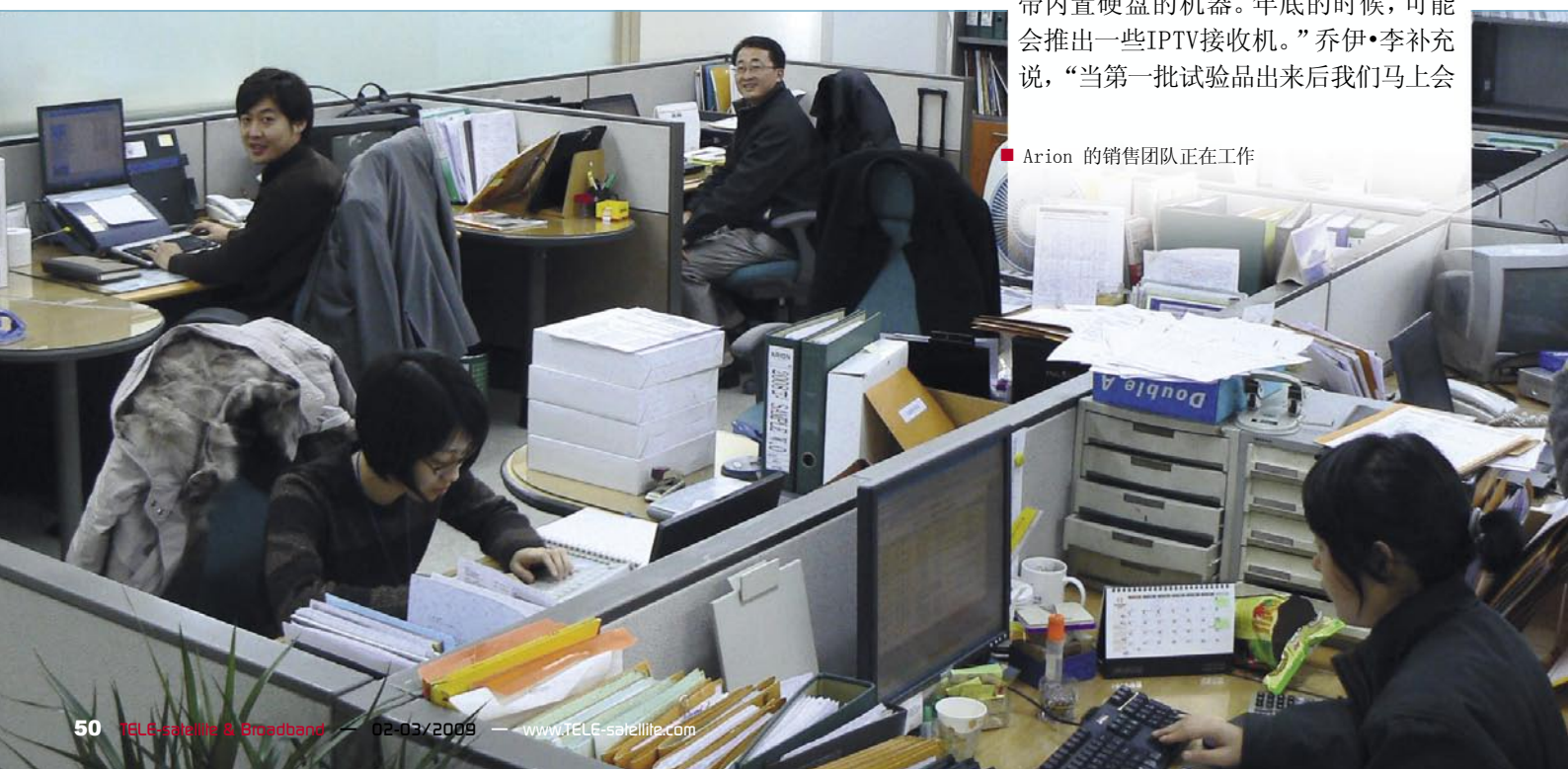
■ Arion 的销售团队正在工作

Arion公司的产品包括哪些呢？“在欧洲，无疑是高清产品这一块。”山姆·张又列举了2009年欧洲市场的产品线：“2009年第一季度，我们准备推出一款高清录像接收机，就是具有外接硬盘功能的机器。而二季度则要推出一款带内置硬盘的机器。年底的时候，可能会推出一些IPTV接收机。”乔伊·李补充说，“当第一批试验品出来后我们马上会