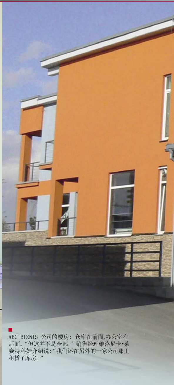
■ ABC BIZNIS 公司的楼房：仓库在前面，办公室在后面。“但这并不是全部，”销售经理维洛尼卡·莱赛特科娃介绍说：“我们还在另外的一家公司那里租赁了库房。”