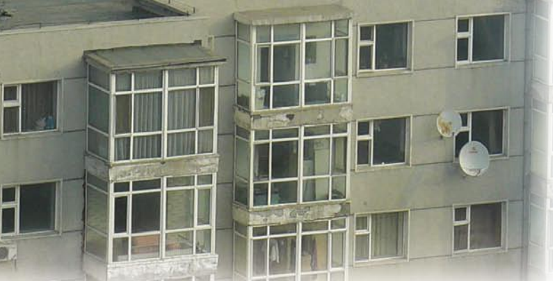
▲ 越来越多的卫星天线正在中国各处出现。 这是在一个中国东部城市里公寓大楼的俯瞰照片。