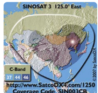
▲ 两个新的中国卫星 CHINASTAR 和 SINOSAT 的场强图。