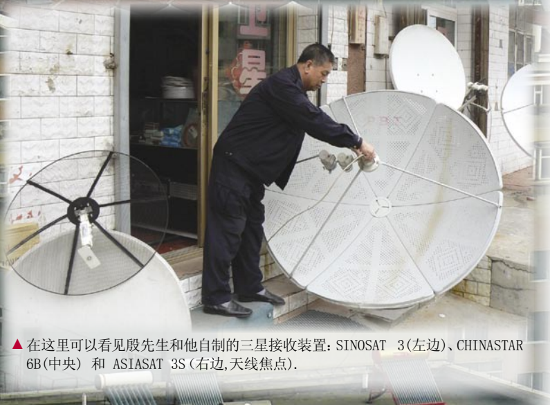
▲ 在这里可以看见殷先生和他自制的三星接收装置：SINOSAT 3(左边)、CHINASTAR 6B(中央) 和 ASIASAT 3S(右边,天线焦点)。