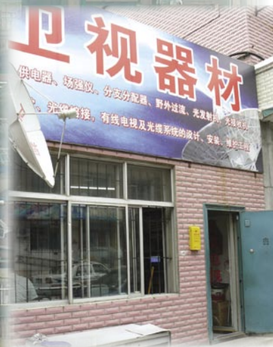
▲ 汤姆先生商店的门口。