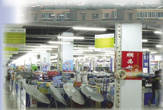
▲在中国一个东部城市的一家电器商场的四楼上,一个卫星玩家可以找到任何他所需要的东西。不仅有前面摆放的天线,而且还有 Ku 和 C 波段 LNB、DiSEqC 开关、卫星接收机以及成英里长的同轴电缆。