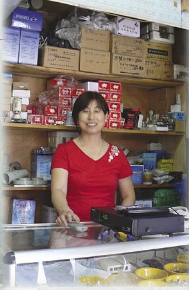
▲ 翁女士在她的小卫星商店中。她跟我们介绍说：“我每个月卖出 200 到 300 个天线。”她也销售直径达 12 米的天线。但是多数情况下她销售的是有线电视器材。