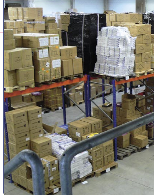
库房一览:卫星器材的货堆

了要完成我们的拓展目标,我们在去年11月搬家后就开始调整我们的整个IT组织结构。我们的计划是在今年3月开始整合商务软件。我们的新店铺系统将在2007年的第三季中实现在线联机:它将直接受理和处理客户的订单,第四季启动语言模块,首先是英语和法语,然后是其它语种。”