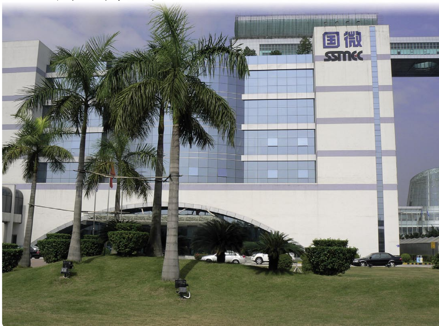
棕榈树伫立在工业园区里。太平洋就在深圳南山SSMEC公司办公大楼的不远处，SSMEC公司是SMiT公司的股东之一。

有众多高科技公司入住的深圳南山工业区内那超大规模的高科技园区，连接着宽得令人难以置信的多条高速公路（包括自行车道），在IT企业SSMEC公司的建筑物里，能找到CAM的生产商SMiT公司的总部。SMiT公司，是2003年从SSMEC公司分离出来并成立的。自从它成立以后，已经吸引了包括Mayfield、GSR、Walden、