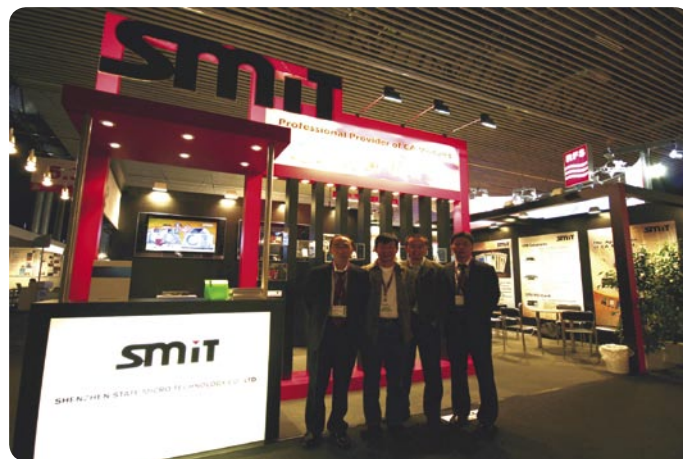
SMTi公司的工作人员在2006年阿姆斯特丹的IBC展会上展示他们最新的CAM模块产品

SMTi的最初客户是数字电视的运营商和付费电视的节目供应商，他们订购了大量的模块。