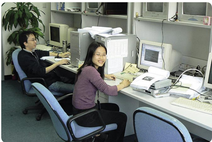
软件开发工程师们正在忙于改进用于有线电视前端的专业模块，该模块可以同时4~6个频道进行解码，到2007年中，将可以同时8~10个频道进行解码。