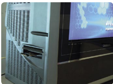
SMTi公司CAM模块的一个应用实例：内置了卫星接收机的长虹宽屏电视机

SMTi的CEO黄学良面对未来充满了自信：“我们准备向全世界发送大量的产品，而且所有这些都将是经济的价格。”