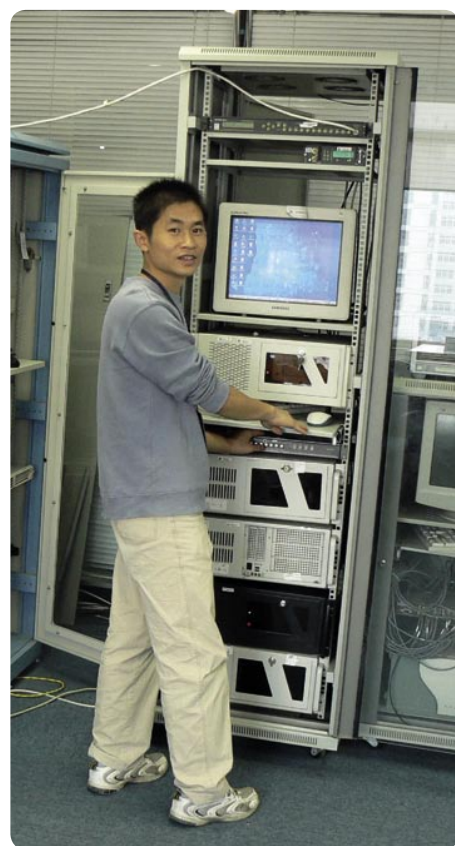
正在进行模块性能检验